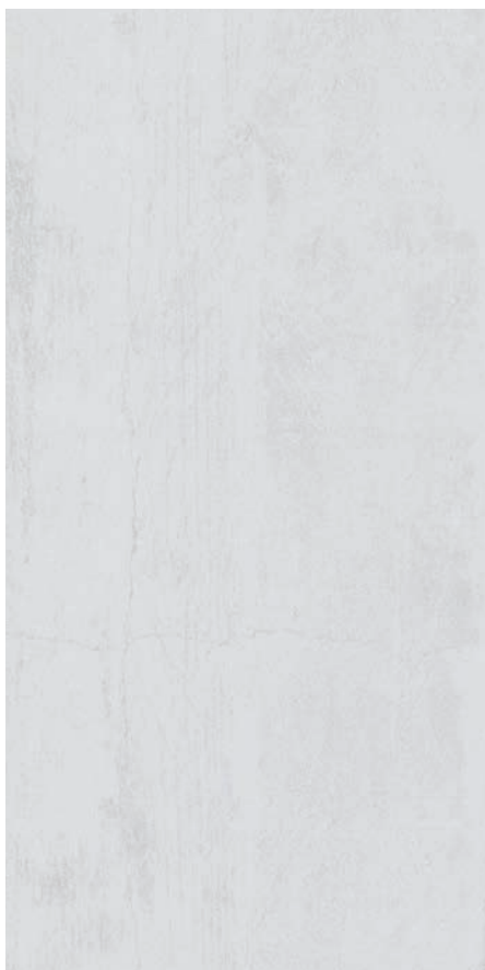
30 x 60 cm (12 x 24) UI.CC.BIA.1224