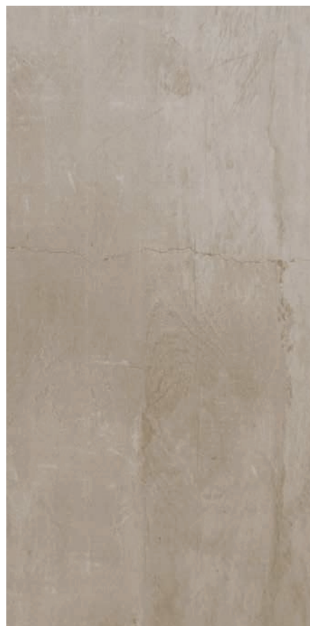
30 x 60 cm (12 x 24) UI.CC.GRG.1224

Tous les items présentés dans ce document font partie du programme d'inventaire Olympia. Pour les commandes spéciales, veuillez contacter votre représentant de Tuiles Olympia.